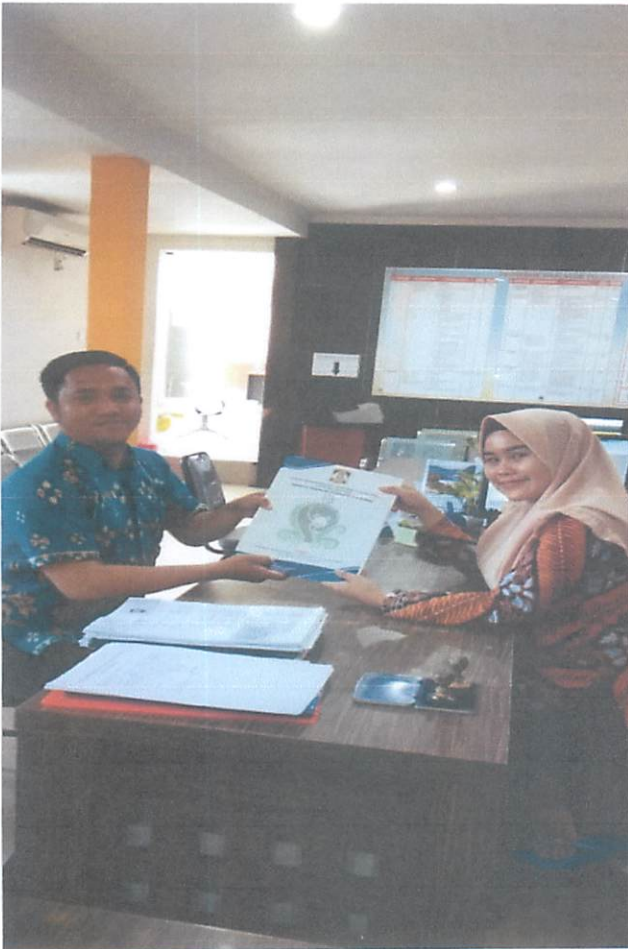
Kec. Bpp Tengah

Pelayanan Petugas Disdukcapil dalam rangka jemput bola pengambilan berkas pembuatan Akte Kematian dan penyerahan kembali Akte Kematian yang sudah jadi di Kecamatan Balikpapan Tengah dan Kecamatan Balikpapan Barat.