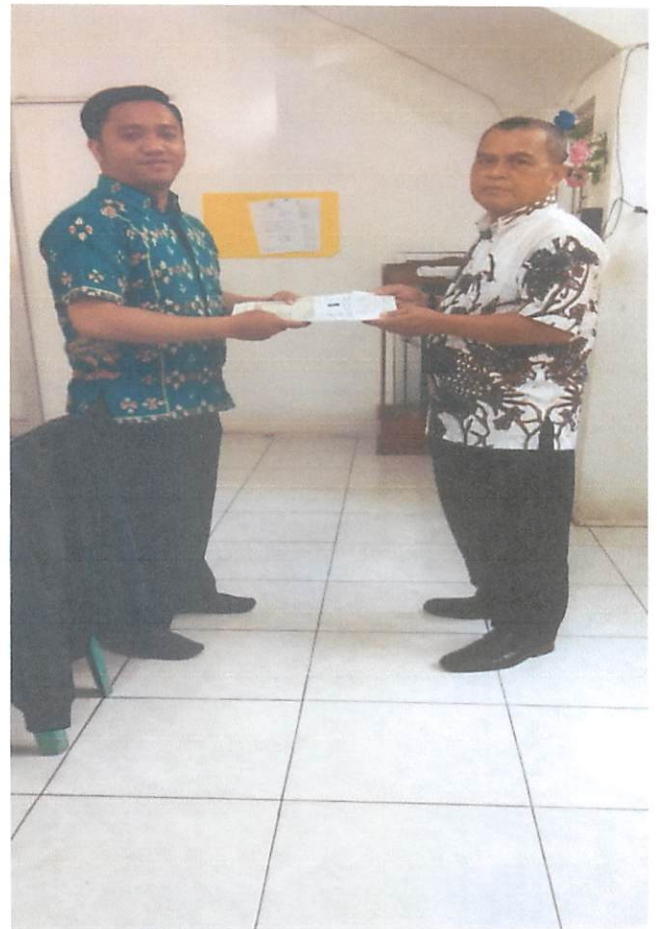
Kec. Bpp Barat

Pelayanan Petugas Disdukcapil dalam rangka jemput bola pengambilan berkas pembuatan Akte Kelahiran dan penyerahan kembali Akte kelahiran yang sudah jadi di Rumah Sakit Balikpapan Baru, RS Kasih Bunda, RS Asih,