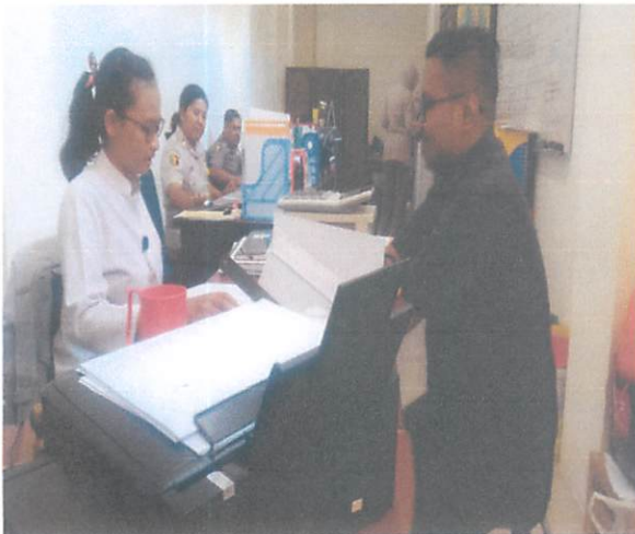
RS "Balikpapan Baru"