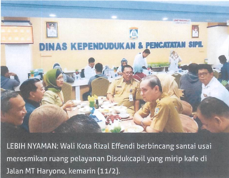
LEBIH NYAMAN: Wali Kota Rizal Effendi berbincang santai usai meresmikan ruang pelayanan Disdukcapil yang mirip kafe di Jalan MT Haryono, kemarin (11/2).